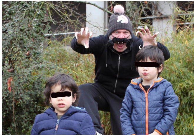
© Géraldine Le Tirant / Lillico