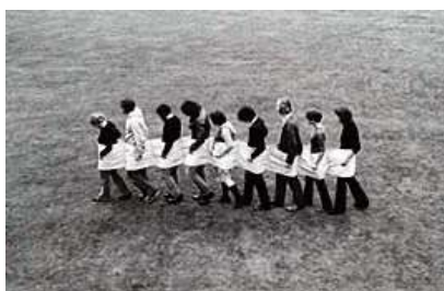
Franz Erhard Walther, Kurz vor der Dämmerung , 1967