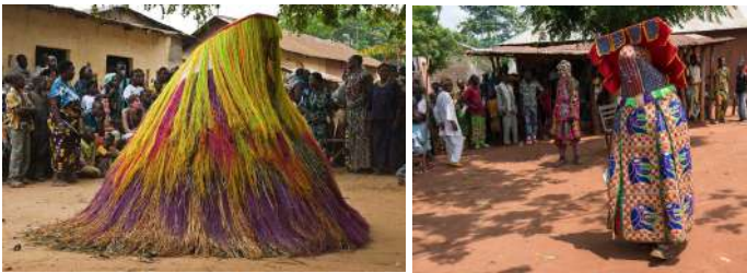
Figure du Zangbeto, Bénin