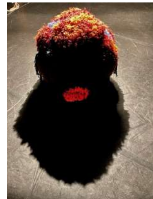
Exemples de cocons, formes et matières qui seront présents dans la scénographie.