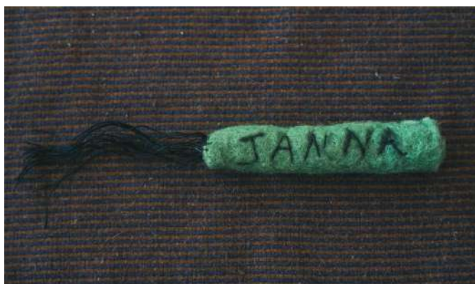
Doudous réalisés dans le cadre des ateliers menés au SAJ de la Courneuve en 2025