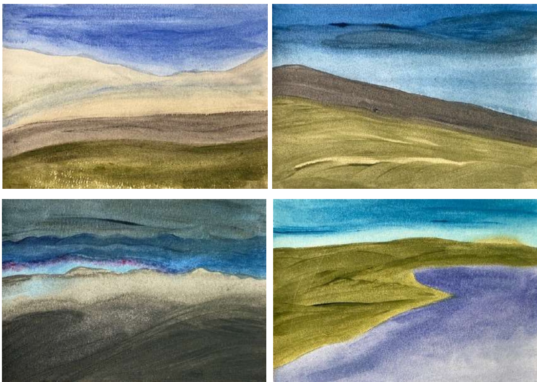
Essais de paysages en aquarelle sur tissu

Actuellement, j'utilise l'aquarelle, de la confiture, des feutres fins, la teinture végétale et je fais mes essais sur du papier et sur du tissu coton et lin.