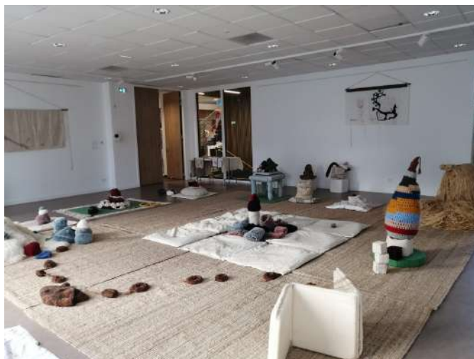
Terrain vague en travail lors de la résidence à la MJC de Pacé en décembre 2024

Panoramique n°3 - LES GRANDES ÉTENDUES peut donc se présenter comme une installation en exploration libre pour les bébés et les adultes. Un espace pensé comme un terrain vague qui se découvre en touchant, en regardant, en écoutant, en sentant. Les spectateurs sont invités à rentrer dans cet espace pour y passer un moment en partage sensitif et ludique tout en douceur. Tous les sens sont mis en éveil par l'activation de toutes les matières formant ce terrain vague. Il s'agit de proposer au public un espace habité par les états d'enfance où la liberté et le dépassement de soi sont au centre. Ici, les mouvements d'adultes et d'enfants mettront en route l'activation de ce terrain vague de manière naturelle. L'activation par une partie des spectateurs permettra l'activité ou la passivité, l'action ou la contemplation, la présence et l'absence par le coucou-cache-cache. Le paysage sera en perpétuelle transformation par l'activation elle-même. Par cette mise en mouvement de la matière textile on approchera l'exploration corporelle presque chorégraphique. Adultes et enfants pourront ainsi observer cette poésie des corps offerte par les bébés dans l'activation de ce terrain vague, les regarder nous indiquer leur présence au monde dans leur mouvement et leur libre arbitre.