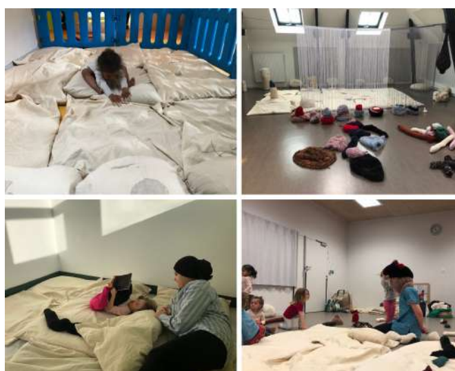
Installation en travail en format tapis lors d'une résidence en crèche